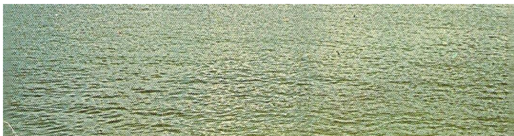
Most srpskih tajkuna – iz ptičje perspektive

Zamislite da se Predsednik samo dosetio da prozove i ove Kartele, ova neformalna udruženja građana, zadužena za širenje raspoloženja i kulture, a kultura je opijum za narod. Koja bi to utakmica bila. Ko bi više, ko bi dalje! I možda bi to tada bio dvostruki most, kao dvostruke trake na autoputevima koji, poput svilenih konaca, sijaju kroz cvetne ćilime naših livada i šume. Pa jednim mostom ideš u jednom pravcu, a drugim mostom ideš u drugom pravcu, a oni spojeni, i nema jaza među njima da, opet nedajbože, neko ne isklizne pa se omakne u mutnu reku.