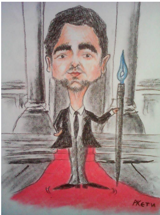
Карикатура Кети Радевске