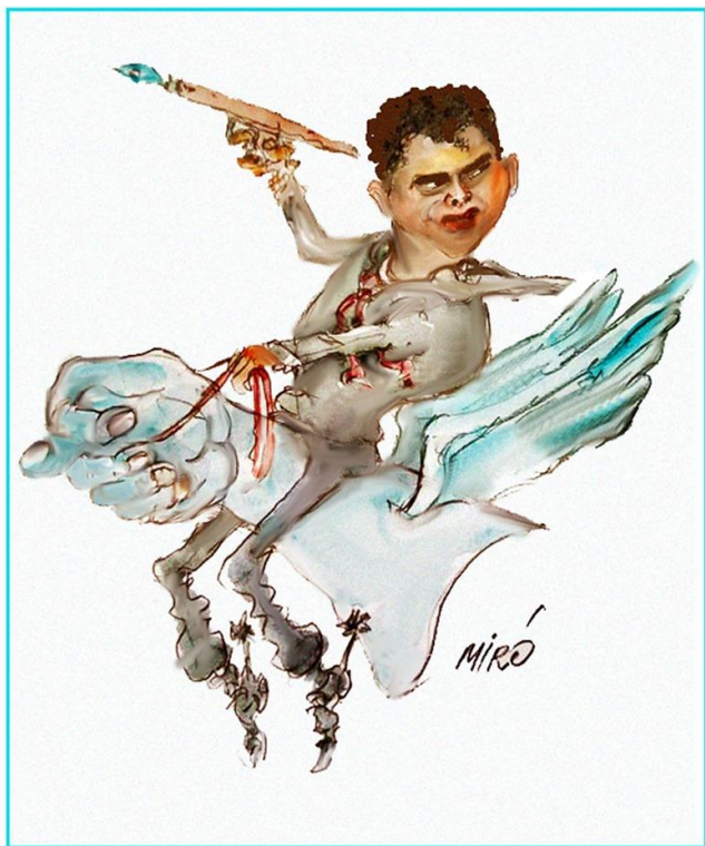
Карикатура Мира Георгијевског