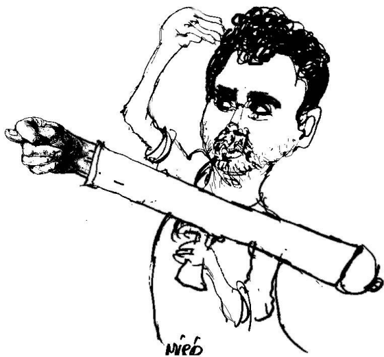
Карикатура Мира Георгијевског