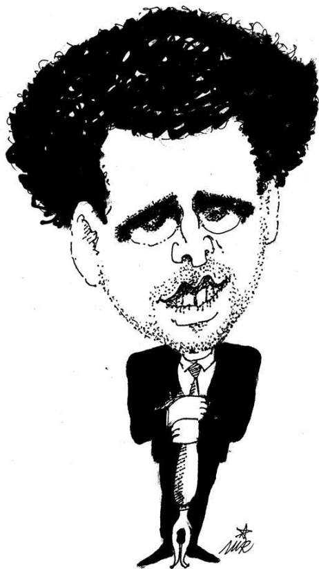
Карикатура Милорада Ранкова