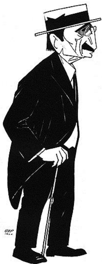
Пјер Крижанић: „Бранислав Нушић“